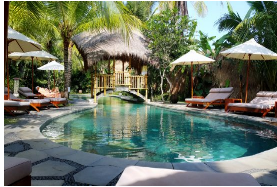
Kuta: hotel Sol house Bali Legian ****