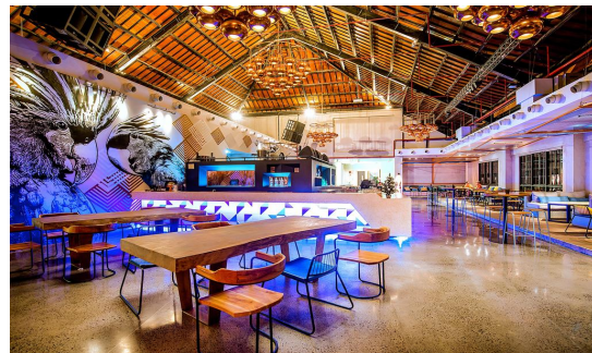
Gili Trawangan: Hotel Ergon Pandawa ****